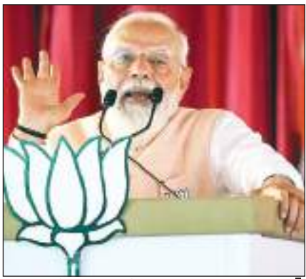
प्रधानमंत्री नरेंद्र मोदी ने क्रांतिधरा मेरठ से चुनावी शंखनाद किया।