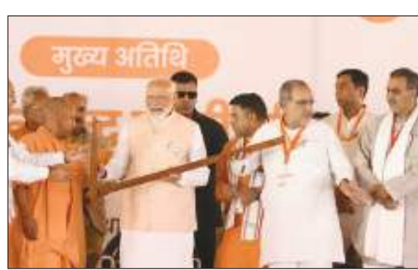
'3 करोड़ महिलाओं को लखपति दीदी बनाने पर काम हो रहा'

अब मेरे दिमाग में कोई संशय नहीं है। भाजपा की अगुआई वाला एनडीए 400 का आंकड़ा पूरा करेगा। नरेंद्र मोदी तीसरी बार प्रधानमंत्री बनेंगे, क्योंकि हमारी सरकार ने 10 साल में दोस काम किया है। विपक्ष लोगों का भरोसा जीतने की